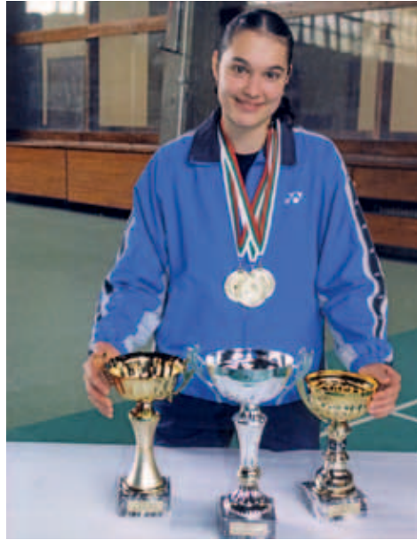
Петя Неделчева - най-титулования български бадминтонист