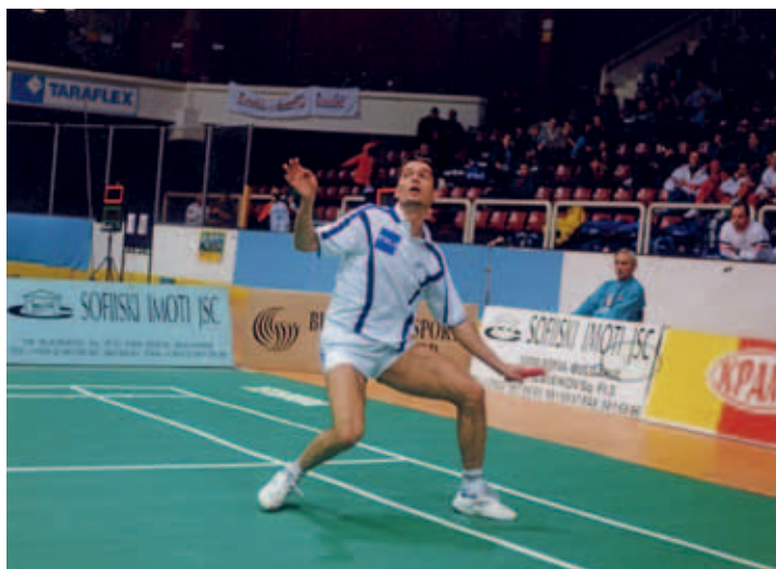
След олимпийското злато Пол-Ерик Хоер Ларсен отново е медалист, но бронз на Европейското първенство 1998, София