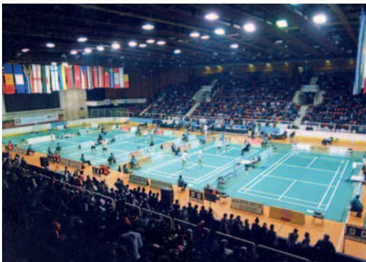
“Зимният дворец” беше арена на много шампионати от най-висок ранг на бадминтона. Тук бяха организирани европейски и световни първенства