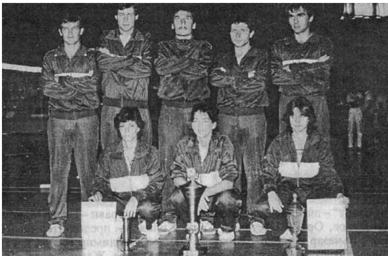
Отборът на СКК "Старт" София- носител на Олимпийската купа 1985 г.