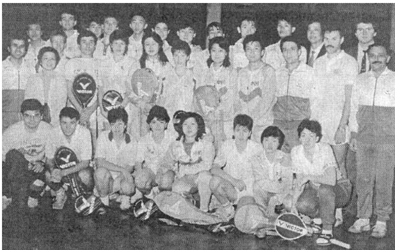
Гранд Хотел Варна -1988 г. – Съвместен спретен лагер с китайските младежки отбори