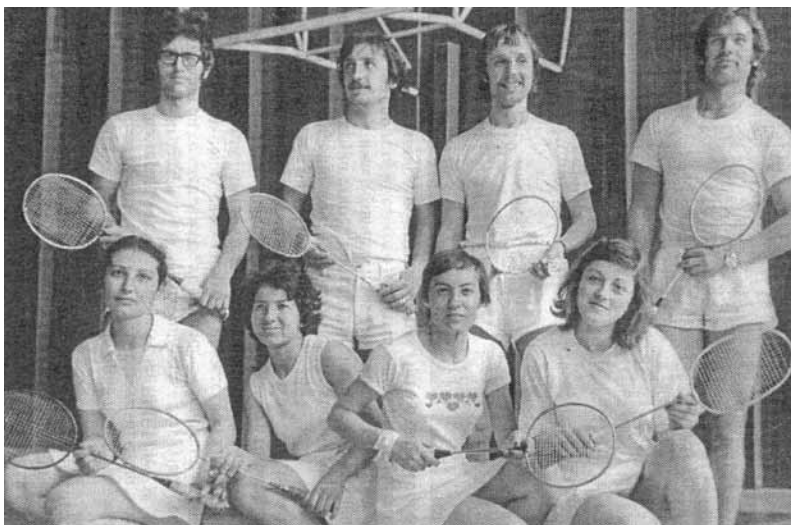
Мъжкият и женският отбор на МК”Кремиковци” – финалисти за петата Републиканска спартакиада